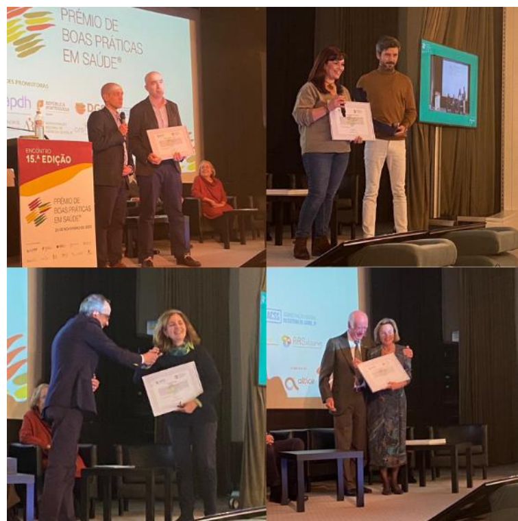
Vencedores do PBPS de 2022 a receber os seus prémios

A APDH agradece a todas as entidades promotoras do PBPS, à Comissão Organizadora (16 membros), de Honra (33 entidades) e Científica (57 membros), bem como a profissionais e equipas de saúde que apresentaram projetos em 2022.