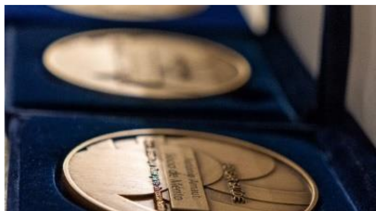
Medalhas entregues aos Sócios homenageados ou aos seus familiares

Por último, foi realizada, como ato final do 9º Congresso Internacional dos Hospitais da APDH, a 25 de novembro de 2022, a Cerimónia de Homenagem , onde foram homenageados 15 Sócios, aos quais foi atribuída a distinção de Sócio de Mérito e a três ilustres personalidades, aos quais foi atribuída a distinção de Sócio Honorário.