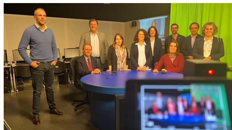
Final da sessão em Lisboa

Esta formação pretendeu dotar os seus formandos com competências no relacionamento com os media, pela simulação de entrevistas em contexto real e aprendizagem dos principais conteúdos relacionados com estas dinâmicas.