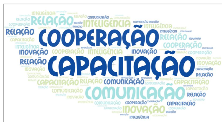
‘Capacitação’ foi a palavra mais ouvida do evento

As principais conclusões deixaram um estímulo, assente numa desafiadora nuvem de palavras – as mais ouvidas e repetidas.