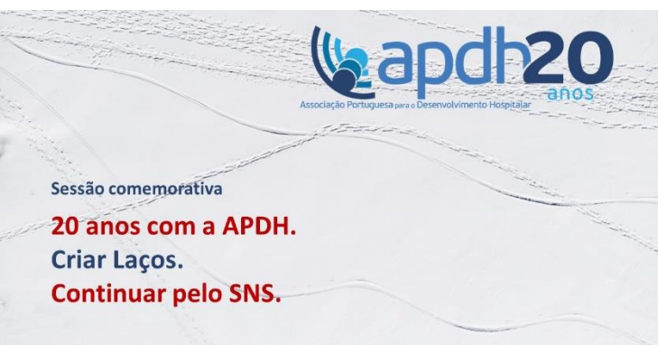
Sessão comemorativa dos 20 anos da APDH

Os oradores convidados refletiram sobre o papel que reconhecem no desempenho da APDH nestes 20 anos e deram a sua visão sobre que papel poderá a Associação desempenhar no futuro.