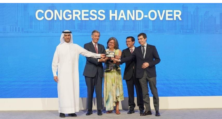
A passagem de testemunho para o Congresso em Lisboa