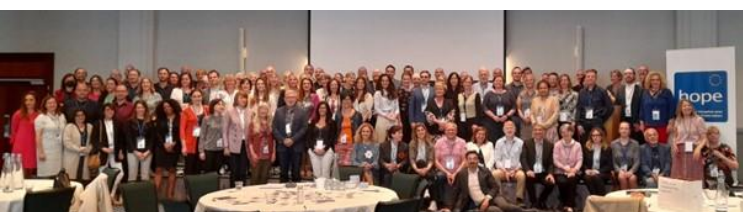
No final da Agora em Bruxelas

O Programa decorreu de 9 de maio a 2 de junho, e terminou com a Reunião Europeia de Avaliação e Conferência Final ( HOPE Agora ), que decorreu de 3 a 5 de junho de 2022, em Bruxelas, Bélgica.