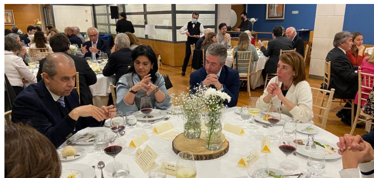
Debate à volta da mesa 4