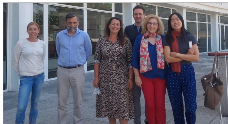
Participantes estrangeiros em Portugal

Portugal recebeu seis profissionais de saúde europeus (de Espanha, da Suécia, Grécia, Holanda, Suíça e do Reino Unido). Ao longo das quatro semanas, estes participantes foram distribuídos por seis hospitais nacionais a recolher exemplos de projetos e das boas práticas que se praticam em Portugal, juntando-se uma vez por semana numa instituição de saúde, para partilharem as suas experiências.